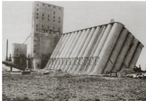
Figure 1: Rupture par rotation de la fondation superficielle du complexe de silos à grains de Transcona (circa 1913).

Le complexe de silos à grains de Transcona (Canada - Nord-Est de Winnipeg) consistant de 5 rangées de 13 silos (28 mètres de haut / 4.4 mètres de diamètre interne, épaisseur 5cm en béton - toit \sim rectangulaire de 20cm d'épaisseur) est rentré en service en septembre 1913. Mi-October 1913, alors que le taux de remplissage arriva à 87.5%, une rupture (lente) en rotation s'est produite. L'inclinaison finale (au bout de 24h) se 'stabilisa' autour de 27^\circ . La fondation de cet ouvrage est un simple radier (dimensions b = 23.5 m, L = 59.5 m, épaisseur 1.5 mètre), à une profondeur de 3.7 m au dessous de la surface. On notera que le grain stocké avait un poids de \gamma = 13.81 \text{ kN/m}^3 (valeur prenant en compte la 'porosité' de ce milieu granulaire). Un profil simplifié du sol est représenté sur la figure 2. La géologie du site consiste en une couche d'argile de même texture / composition mais 2 couches de propriétés mécanique différentes sont clairement visible.