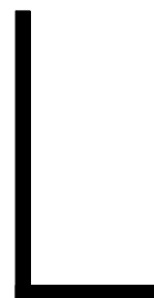
FIGURE 1 – La figure en forme de "L" est constituée de deux rectangles (parallépipèdes de faible épaisseur) rigidement liée l'un à l'autre

Variante du problème : on perce un trou dans le "L" pour le suspendre à un clou situé sur le mur. Il peut ainsi pivoter librement autour du clou une fois placé contre le mur de telle sorte que le clou passe à travers le trou. Quelle est la position angulaire de la figure à l'équilibre en fonction de la position du trou ?